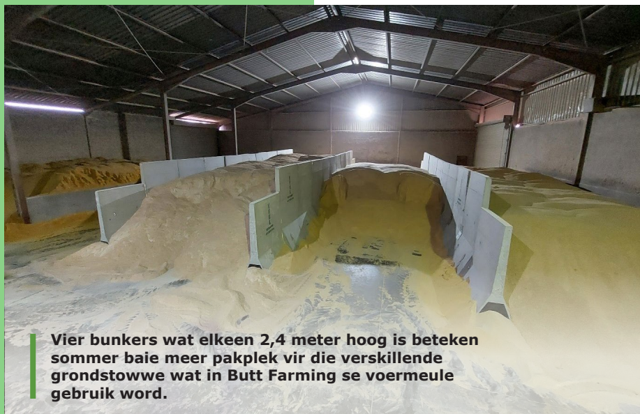
Vier bunkers wat elkeen 2,4 meter hoog is beteken sommer baie meer pakplek vir die verskillende grondstowwe wat in Butt Farming se voermeule gebruik word.

Die bestuur en berging van die grondstowwe is 'n groot deel van die voermakery.