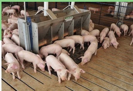
Grant Lavers se varke is spekvet, vrugbaar en gesond danksy 'n goeie voerprogram wat begin by die behoorlike bestuur van grondstowwe.

Grant sê: "Ons was op soek na 'n produk wat ons kan gebruik om die beperkte ruimte in die voermeule optimaal te benut vir die berging van die verskillende bestanddele. Dit is vir ons belangrik dat die grondstowwe nie deurmekaar moet raak voordat ons dit volgens die regte resepte vermeng nie." Onbeplande vermenging van bestanddele het uiteindelik 'n invloed op die gehalte van die voer en die prestasie van die diere.